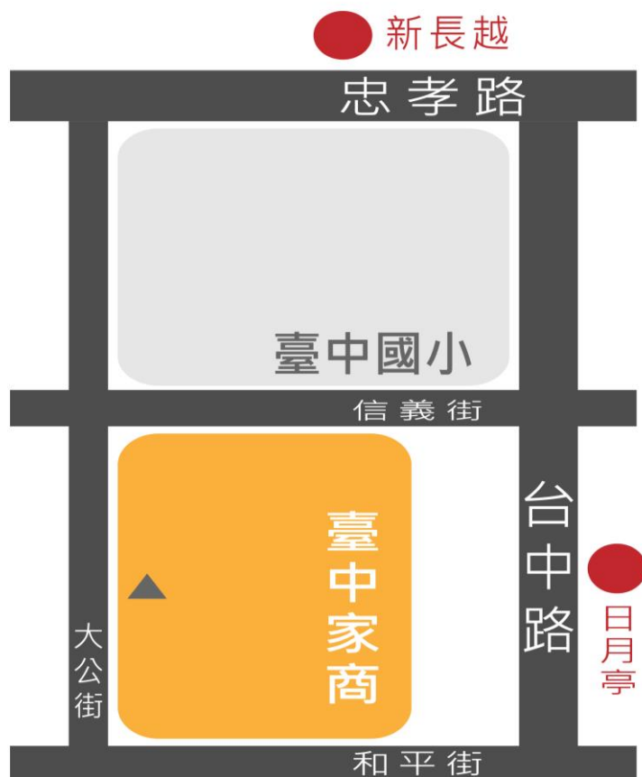
臺中家商週邊停車場