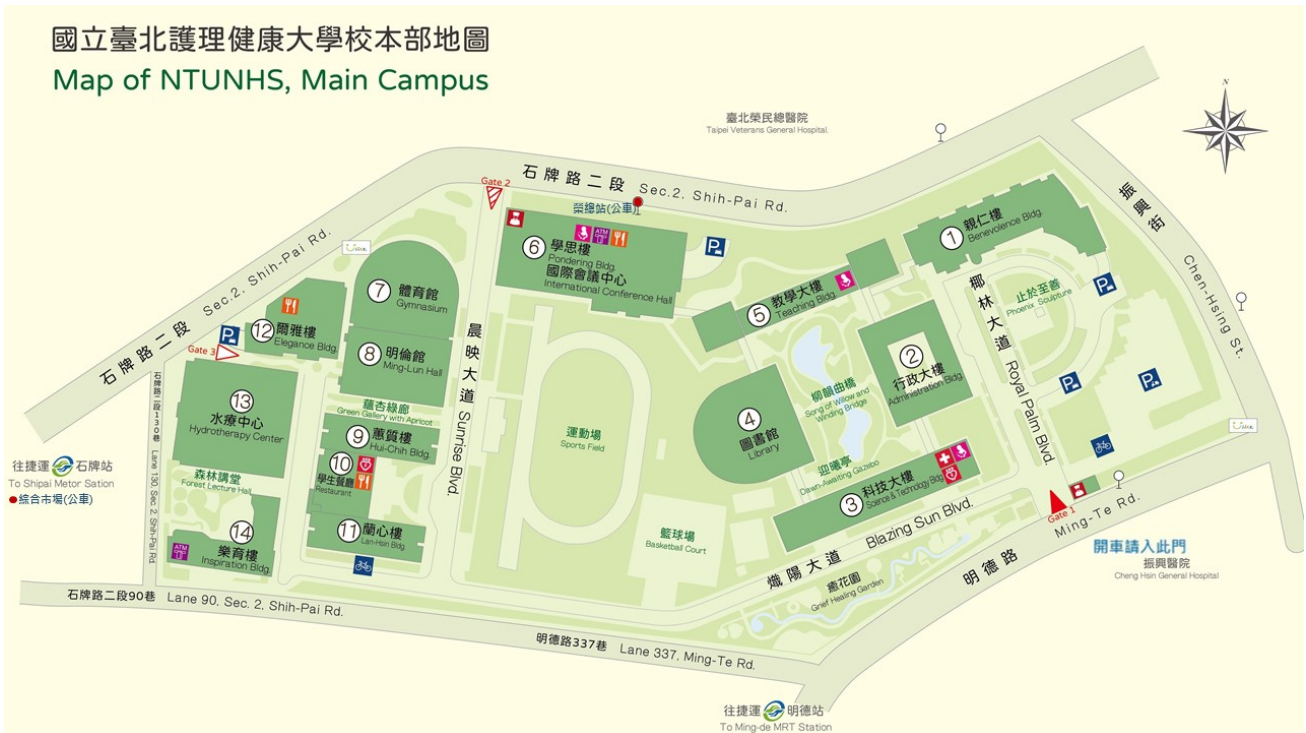
國立臺北護理健康大學校本部地圖 Map of NTUNHS, Main Campus

捷 運：【淡水線捷運石牌站一號出口】右轉過馬路→順石牌路二段往台北榮總直走（約莫 6 分鐘路程）