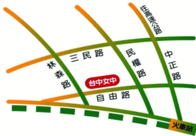
臺中市立臺中女子高級中等學校 110 學年度校園配置圖