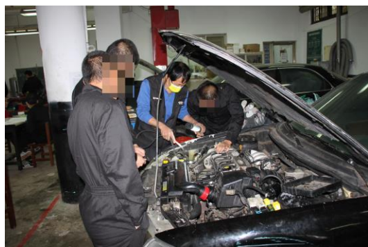
汽車修護班上課照片