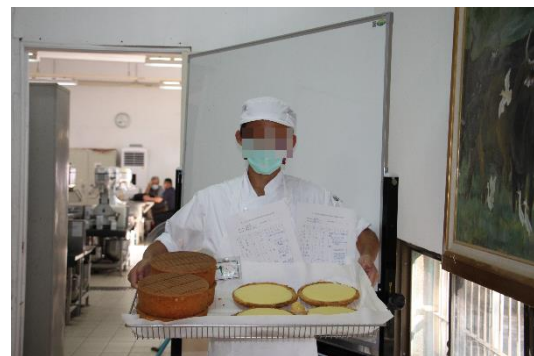
烘焙食品_西點蛋糕作品