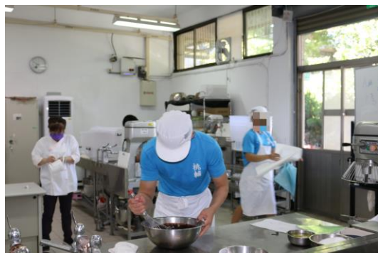
烘焙食品班上課照片