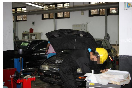
汽車修護檢定術科測試