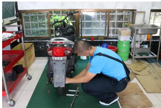
機器腳踏車修護班上課照片