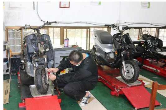
機器腳踏車修護檢定術科測試