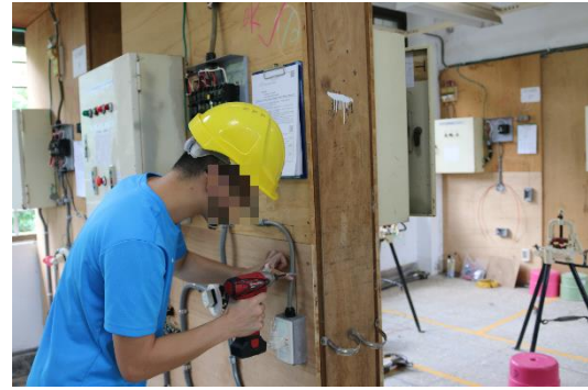
室內配線檢定術科測試