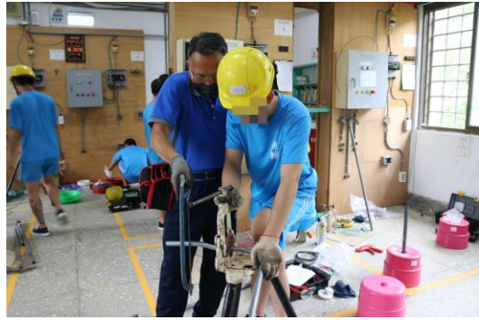
室內配線班上課照片