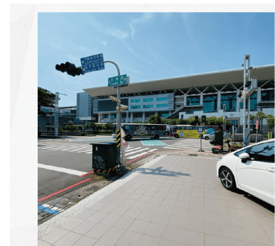
左營高鐵路與重信路交叉 (鄰近左營高鐵莫凡比咖啡)