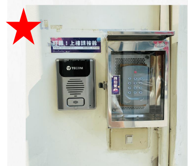
對講機電鈴 (將有專人接待您上樓)