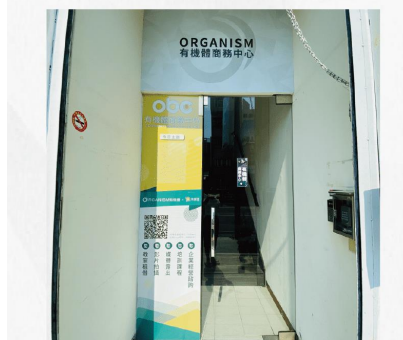
有機體商務中心大門口