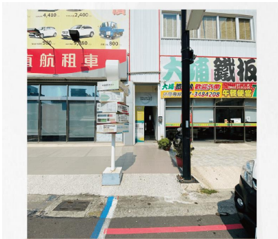
有機體商務中心大門全貌