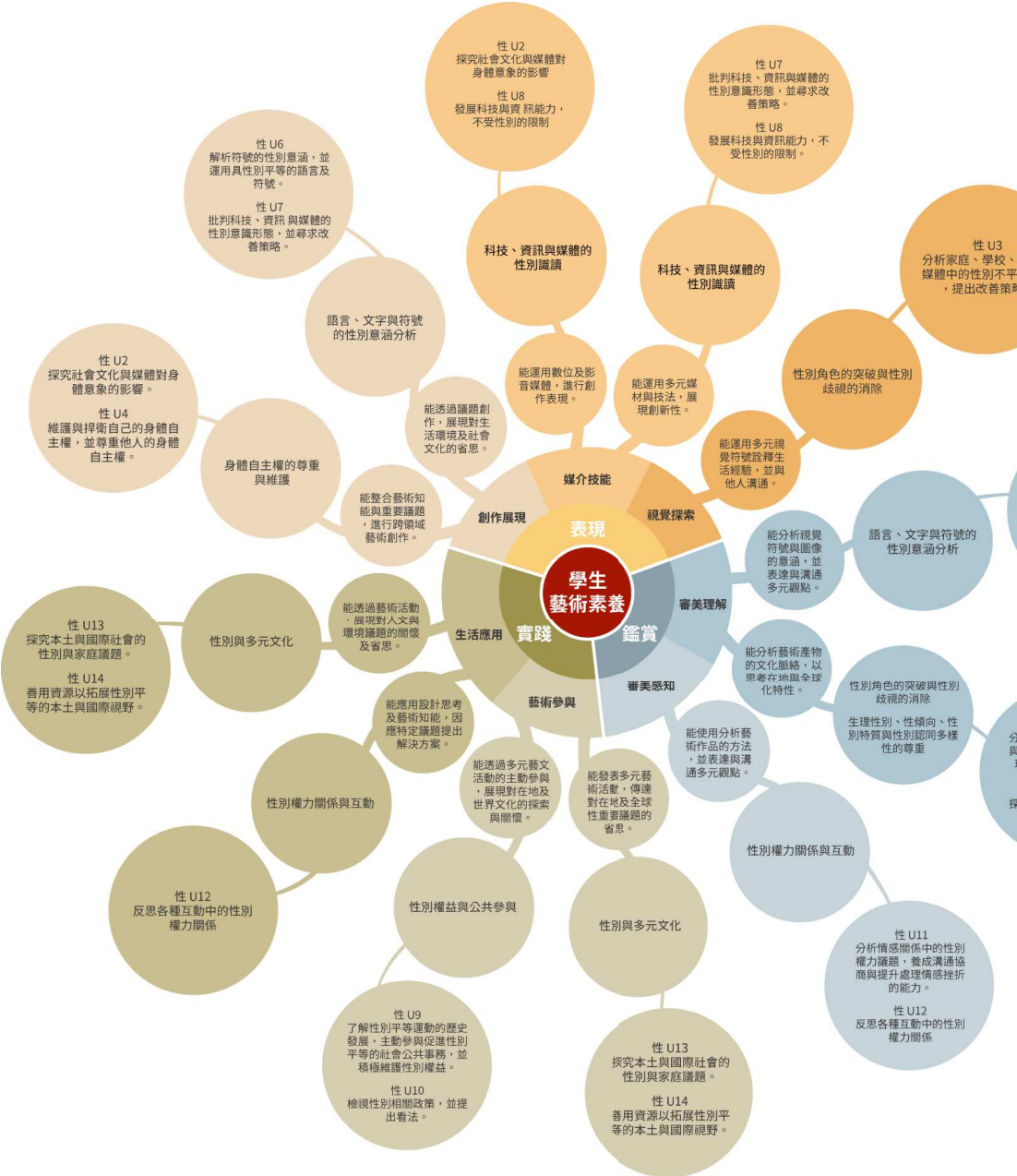
性別平等教育議題融入美術課程地圖示例