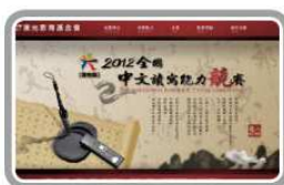
讀寫能力提升計劃或競賽