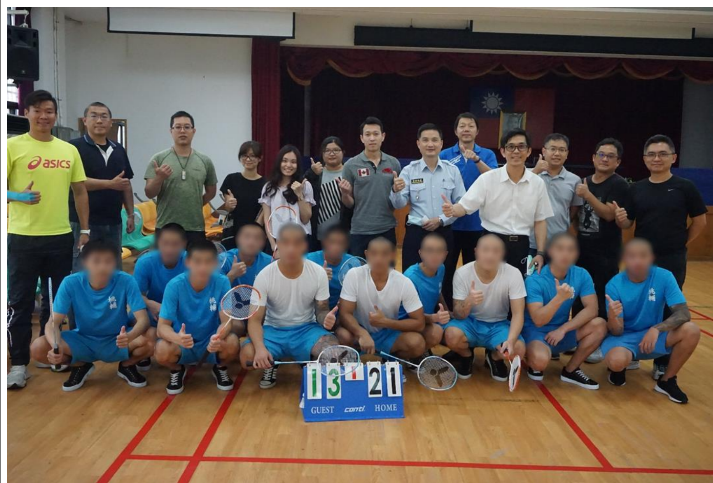
校長、訓導科長 前往禮堂為參賽的同學打氣加油。