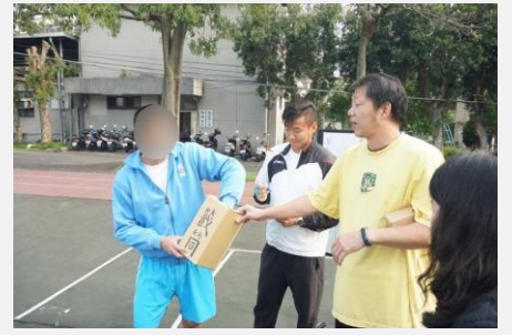
體育老師向學生講解規則