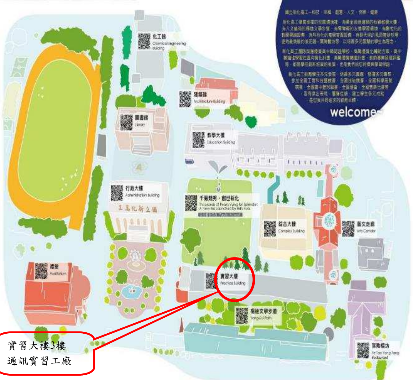
National Hsin-Hua Industrial Vocational High School

國立新化高工·科技·專業·創意·人文·快樂·健康 新化高工專業卓越的校園環境裡，有黃金級建築師的新穎教學大樓，有人文藝術的楊廷文學步徑，有榮耀燦爛的友誼學習環境，有數位化於教學實踐的專科化師資專業團隊，有敢天飛的風雨籃球場景，更有最美麗的浪花廊、實踐體驗等，以培養多元智能的學生為理念。 新化高工積極榮獲優質中職認證學校，實施優質化輔助方案，高中職招生學業功課實化計畫，再續優質化計畫，教育專業及國際進修，都是學校創新經營的指標，也是我們給您的優質學習保證。 新化高工鼓勵學生多元發展，培養多元興趣、發揮多元專長，參加全國工藝科技競賽、全國技能競賽、全國科學展覽、競賽、全國高中籃球聯賽、全國檢會、全國省南北賽等，皆有傑出表現，屢獲佳績，建立學生多元成就，是創我共同追求的教育目標。 welcome