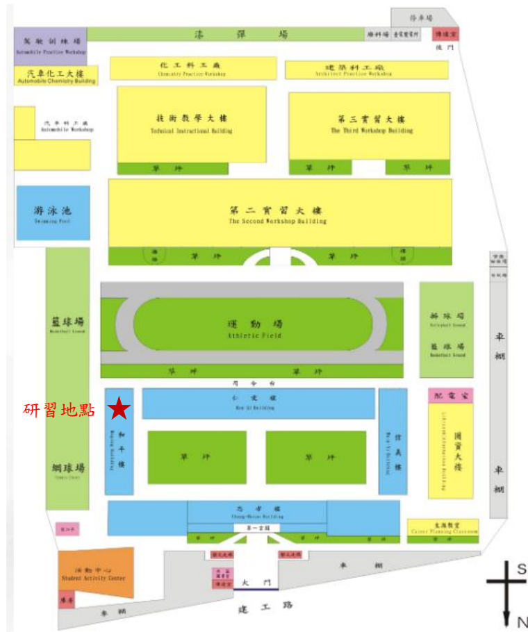
圖2 研習場地位置圖