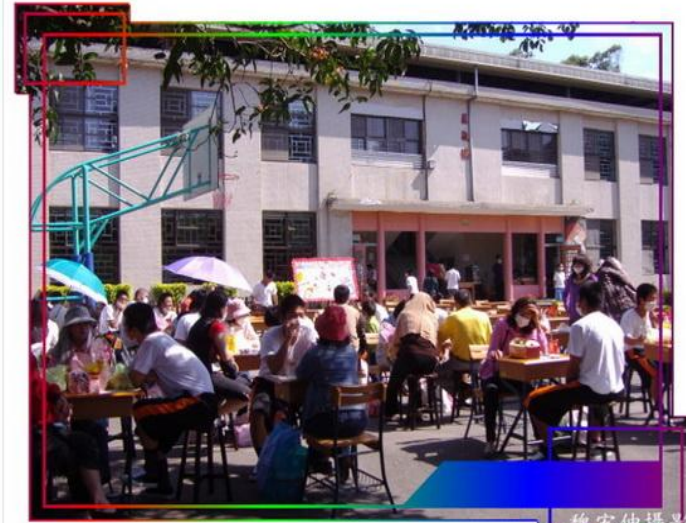
後方佛場 攝於仲攝誌

二、電話及面對面懇親：為增進學生與父母之親子關係，於春節、母親節、及中秋節分別舉辦懇親會，邀請學生家長來院參加，使之在融洽氣氛中拉近親子情感。懇親會之前一日辦理電話孝親活動，讓全體學生都能透過電話，邀請家長前來參加懇親，亦能無形中增進親子間之情感。